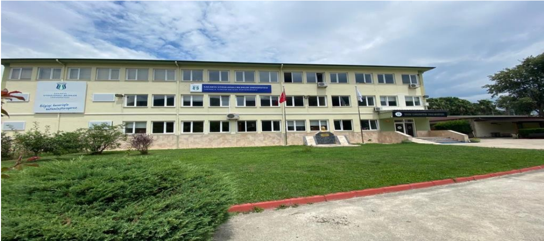
Şekil 1. Sapanca Turizm Meslek Yüksek Okulu Binası

Okulumuz 7141 Sayılı Kanun çerçevesinde Sakarya Üniversitesi bünyesinden ayrılarak 18.05.2018 tarihinde Sakarya Uygulamalı Bilimler Üniversitesi'ne bağlanmış ve ismi Sapanca Turizm Meslek Yüksekokulu olarak değiştirilmiştir.