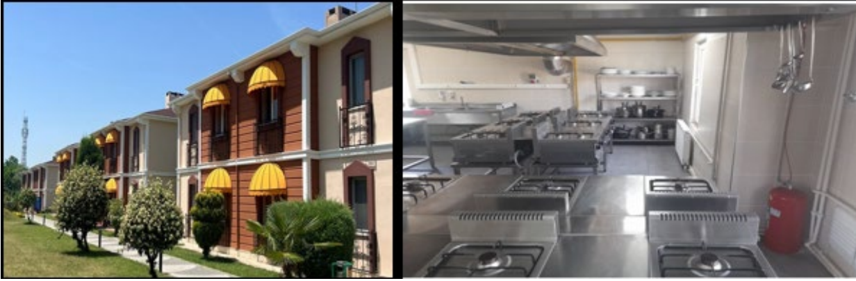
Şekil 3. Uygulama Oteli ve Mutfağı

Ayrıca üniversite bünyesinde faaliyet gösteren “SAPANCA RESORT OTEL” de Aşçılık Programına ait bir uygulama mutfağı bulunmaktadır. Uygulama mutfağı meslek yüksekokulumuz ana binasına 3 km uzaklıktadır.