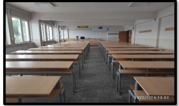
Şekil 2. Bilgisayar Laboratuvarı ve Derslik