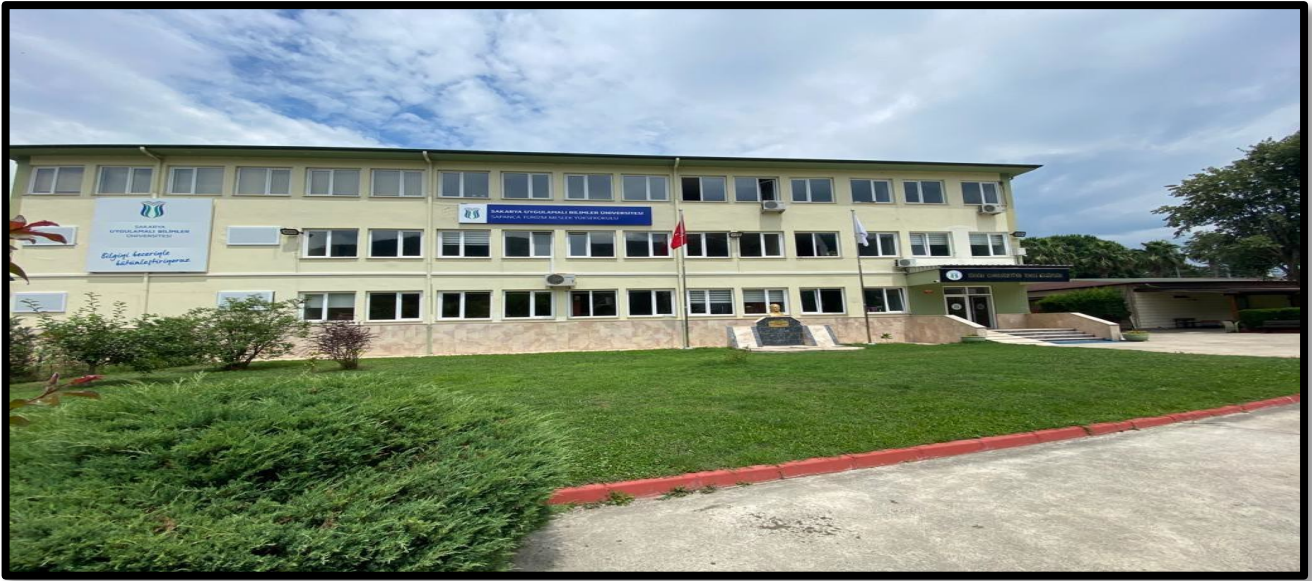
Şekil 1. MYO Yerleşkemiz

Mesleki eğitim-öğretimde hedeflediği yüksek kalite standartlarıyla mezunlarına uygulama becerisi kazandırma yetkinliği ile ulusal ve uluslararası düzeyde adından söz ettiren; iş dünyası ile iş birliği içinde geleceğin nitelikli işgücü ihtiyacını karşılamaya yönelik etkili çözümler üreten, takım çalışmasını teşvik eden, demokratik, şeffaf, iletişime ve değişime açık bireyler yetiştirmek amacımızdır.