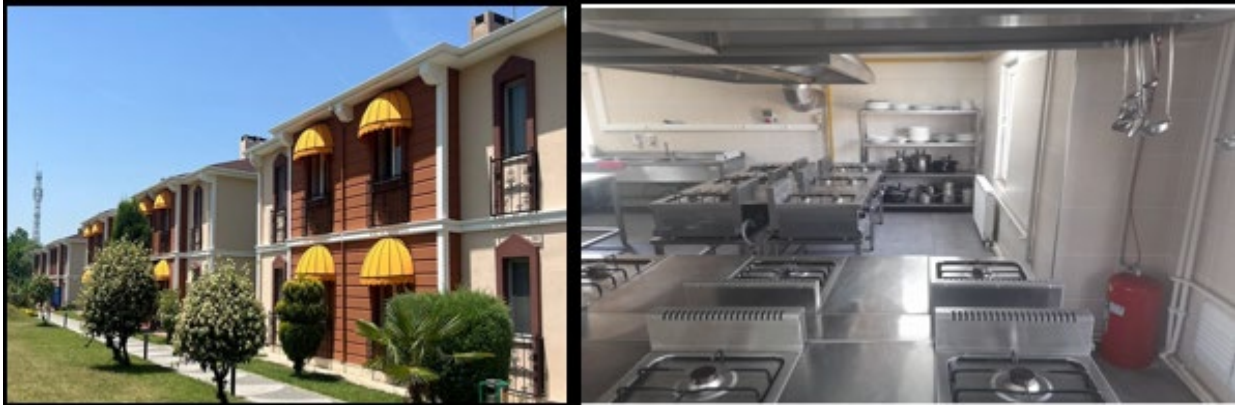
Şekil 3. Uygulama Oteli ve Mutfağı

Ayrıca Üniversite bünyesinde faaliyet gösteren “SAPANCA RESORT OTEL ” de Aşçılık Programına ait bir uygulama mutfağı da bulunmaktadır. Uygulama mutfağı meslek yüksekokulumuz ana binasına 3 km uzaklıktadır.