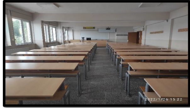
Şekil 2. Bilgisayar laboratuvarı ve Derslik

Ayrıca Üniversite bünyesinde faaliyet gösteren “SAPANCA RESORT OTEL ” de Aşçılık Programına ait bir uygulama mutfağı da bulunmaktadır. Uygulama mutfağı meslek yüksekokulumuz ana binasına 3 km uzaklıktadır.