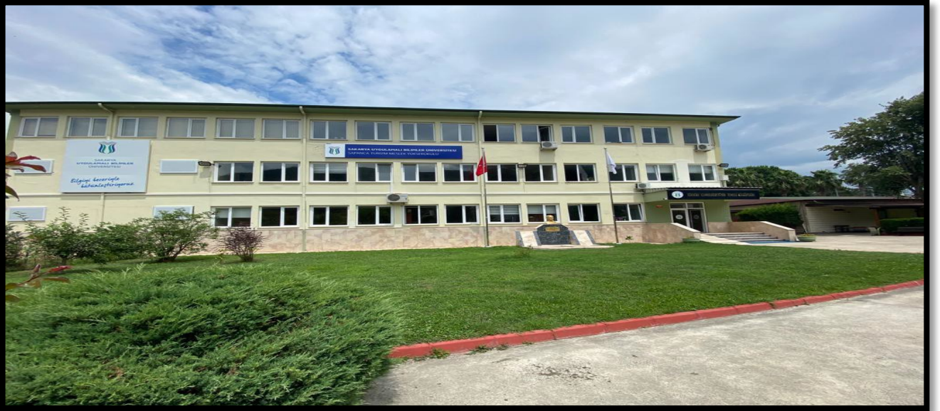
Şekil 1. MYO Yerleşkemiz

Mesleki eğitim-öğretimde hedeflediği yüksek kalite standartlarıyla mezunlarına uygulama becerisi kazandırma yetkinliği ile ulusal ve uluslararası düzeyde adından söz ettiren; iş dünyası ile iş birliği içinde geleceğin nitelikli işgücü ihtiyacını karşılamaya yönelik etkili çözümler üreten, takım çalışmasını teşvik eden, demokratik, şeffaf, iletişime ve değişime açık bireyler yetiştirmek amacımızdır.