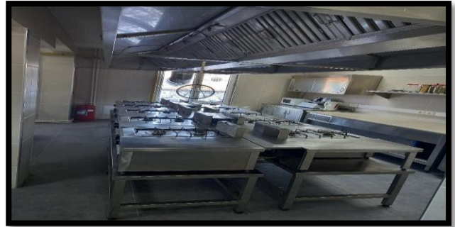
Şekil 3. Uygulama Oteli ve Mutfağı