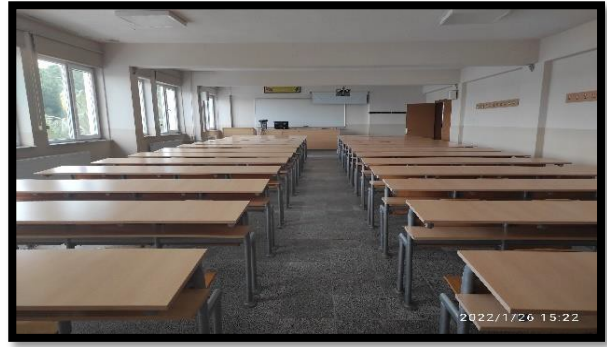
Şekil 2. Bilgisayar laboratuvarı ve Derslik

Ayrıca Üniversite bünyesinde faaliyet gösteren “SAPANCA PARK OTEL” de Aşçılık Programına ait bir uygulama mutfağı da bulunmaktadır. Uygulama mutfağı meslek yüksekokulumuz ana binasına 3 km uzaklıktadır.